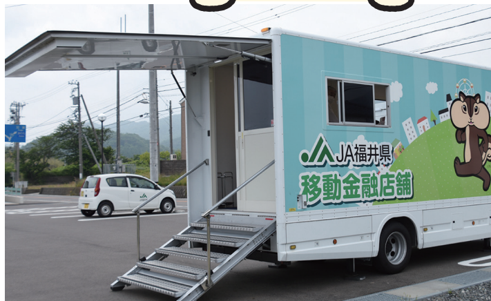
※外観イメージ（実際の車両とはデザインは異なります）