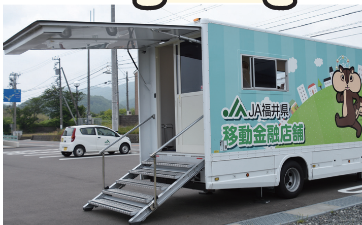
※外観イメージ（実際の車両とはデザインは異なります）