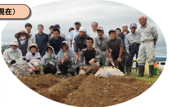
8月26日：秋ジャガイモ栽培研修会(福井市南江守町)