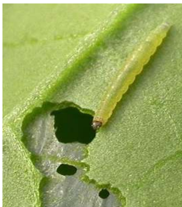
写真 コナガ幼虫と食害痕

農業試験場内のフェロモントラップでは、成虫の誘殺数が多くなっているため、徹底した防除をしてください。